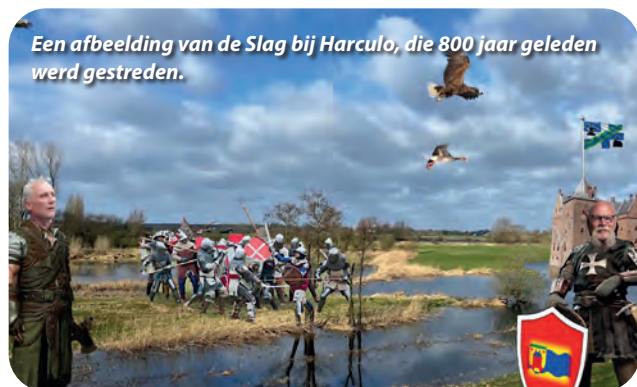
Een afbeelding van de Slag bij Harculo, die 800 jaar geleden werd gestreden.

De geloofsgemeenschap Adventskerk-Oosterkerkgemeente maakt deel uit van een grotere gemeenschap, in buurt, wijk, en stad. Het ontstaan van Zwolle-stad vanaf 1230 en de ontwikkeling van de Sallandse identiteit heeft een eerste stap gekend: de Slag bij Harculo in 1224, 800 jaar geleden.