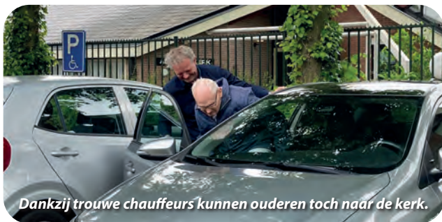
Dankzij trouwe chauffeurs kunnen ouderen toch naar de kerk.

De Adventskerk en de Oosterkerk hebben beiden een coördinator voor de Autodienst. Zij coördineren elk op hun eigen manier het vervoer naar en van de kerk op de dagen dat daar een dienst is. Dankzij hen en een aantal trouwe chauffeurs kunnen ouderen die niet meer op eigen gelegenheid naar de kerk kunnen komen, toch de diensten meemaken.